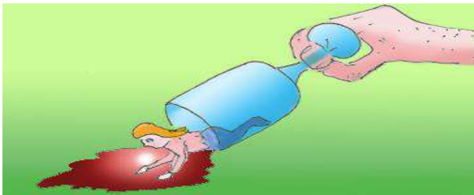
Dem Alkohol davon gekrochen

besser, bis gar nicht mehr vorhanden. Selbst die Schlafstörungen haben sich verbessert bzw. haben sich gänzlich eingestellt. Sie hat wieder Sinn und Freude am Leben gefunden.