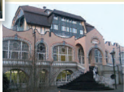
Kath. Akademie „Die Wolfsburg“, Mülheim/Ruhr