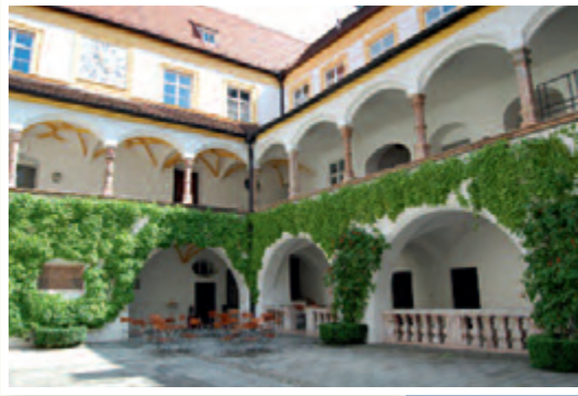
Bildungszentrum Kardinal-Döpfner-Haus, Freising