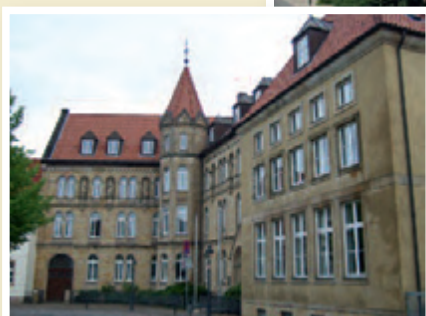
Bischöfliches Priesterseminar, Osnabrück