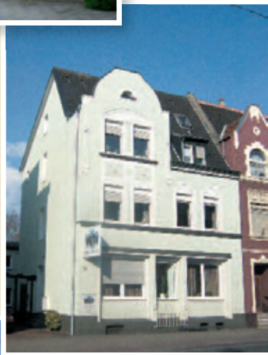
Kreuzbund- Bundesgeschäftsstelle, Hamm