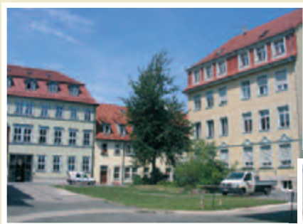
Bildungshaus St. Ursula, Erfurt