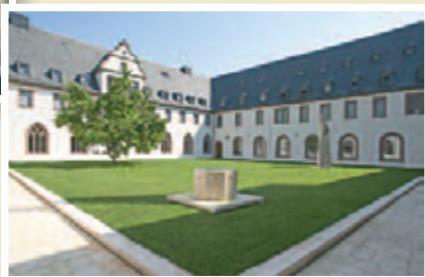
Exerzitienhaus Himmelsporten, Würzburg