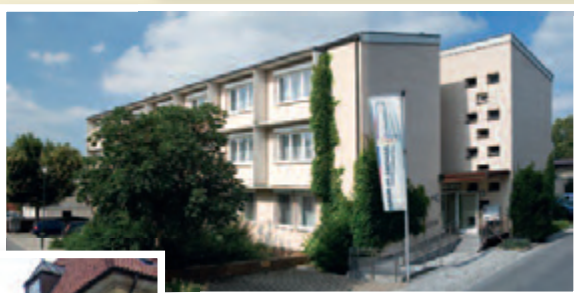
Familienbildungshaus St. Michael, Bad Königshofen